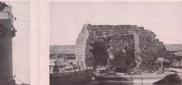
No. 74. Durch unsere Kanonenschüsse demoliertes und als Landungsbrücke des Feindes dienendes Schiff vor Seddul-Bahr