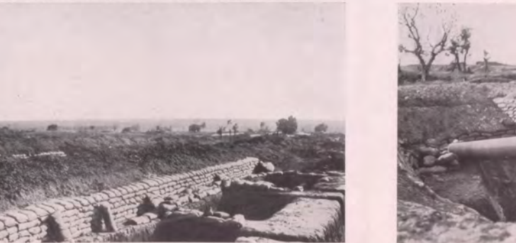
No. 79. Schweres Geschütz des Feindes (als Beute) am Seddul-Bahr