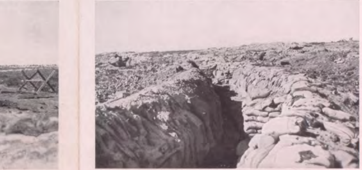
No. 149. Drahtverhaue vor den feindlichen Gräben