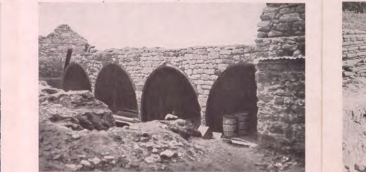
☆ No. 37. Bombsichere feindliche Unterstände auf Seddul-Bahr