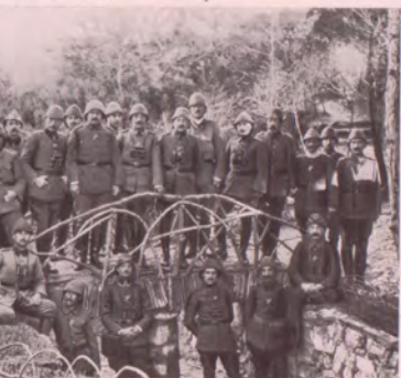
No. 1. Die Offiziere der an den Dardanellen kämpfenden türkischen Streitkräfte