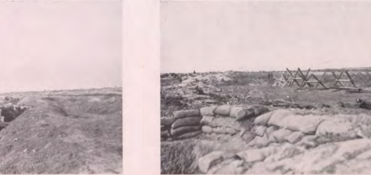
No. 152. Schnell aufgeworfene türkische Schützengräben