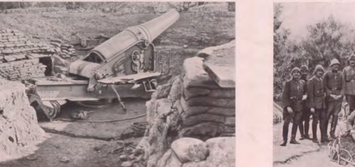
☆ No. 1. Erbeutete 24-cm-Kanone auf Seddul-Bahr