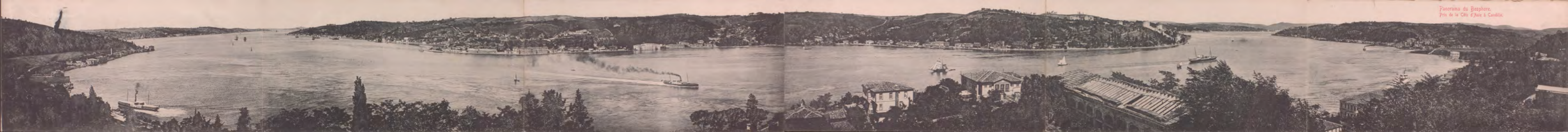
Panorama du Bosphore. Pris de la Côte d'Asie à Candie.