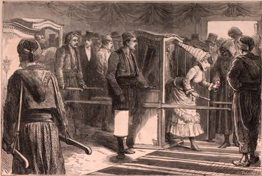
LE CARNAVAL A CONSTANTINOPLE. — L'ARRIVÉE A UN BAL DE LA MEGARÈME, DANS LE FAUBOURG DE PERBA.