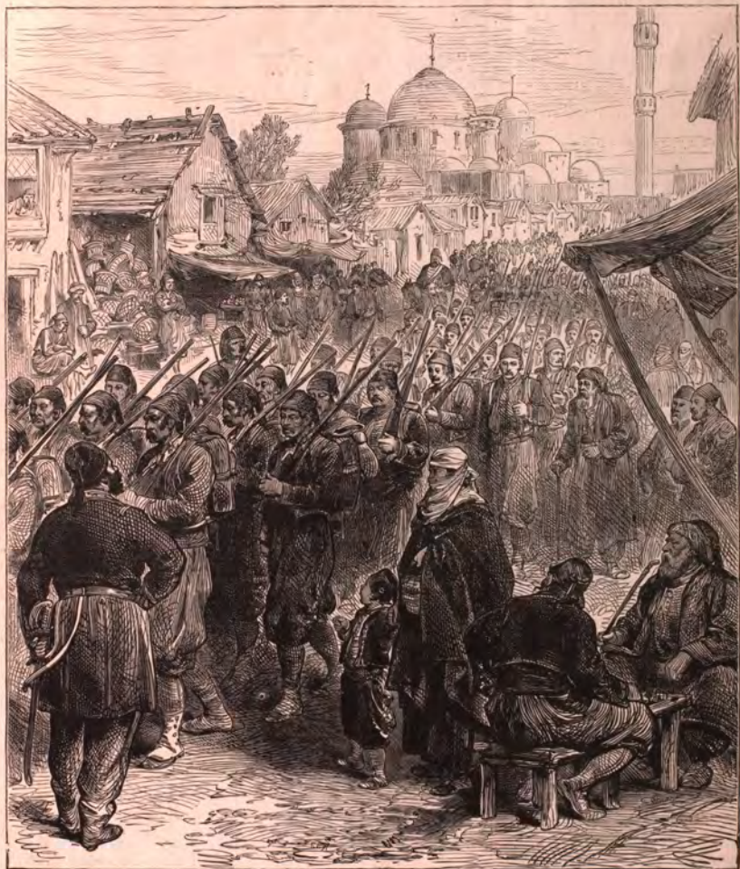
EVENEMENTS D'ORIENT. — LES REDIFS DE L'ARMÉE DE SERBIE REVENANT A CONSTANTINOPLE.