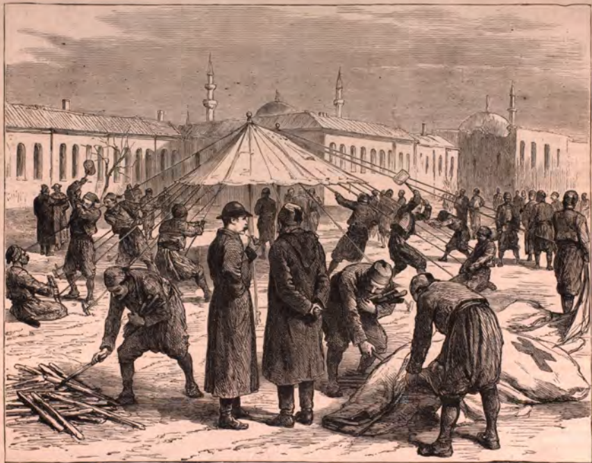
CONSTANTINOPLE. — SOLDATS TURCS S'EXERÇANT A DRESSER DES TENTES. — Voir page 246.