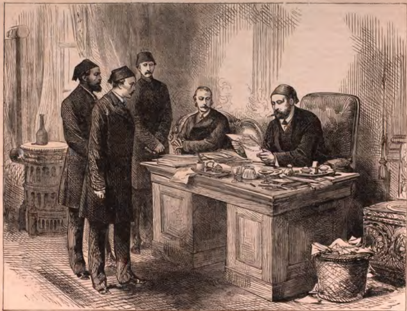
LE BUREAU DE LA CENSURE A CONSTANTINOPLE. — Voir page 210.