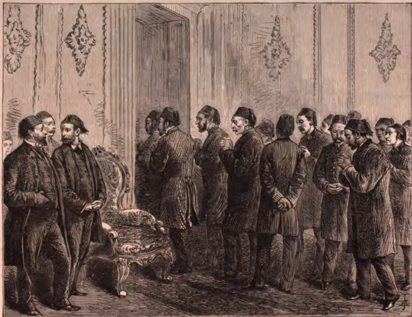
CONSTANTINOPLE. — LES DÉPUTÉS AU PARLEMENT TURC ARRIVANT AU PALAIS DE DOLMA-BAGTCHÉ. — Voir page 218.