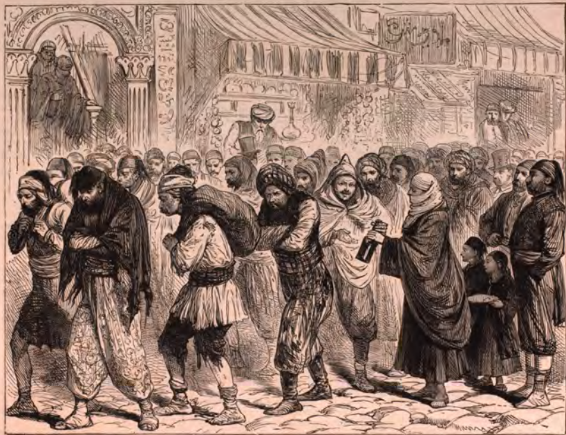
ÉVÉNEMENTS D'ORIENT. — ARRIVÉE DE RECRUES D'ASIE A CONSTANTINOPLE. — Voir page 246.