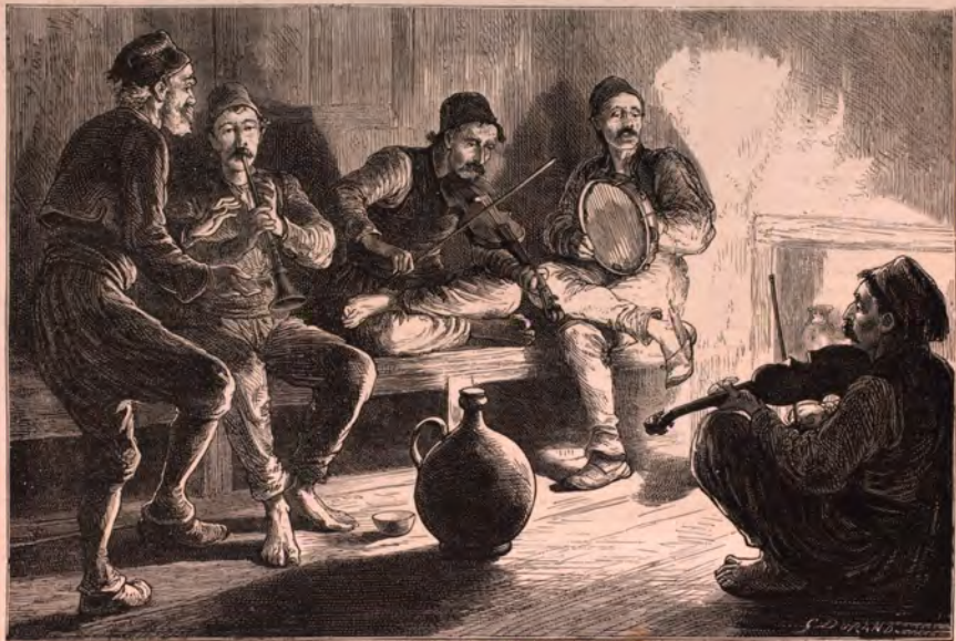
RÉPÉTITION D'UN ORCHESTRE TURC, A CONSTANTINOPLE. — Voir page 109.